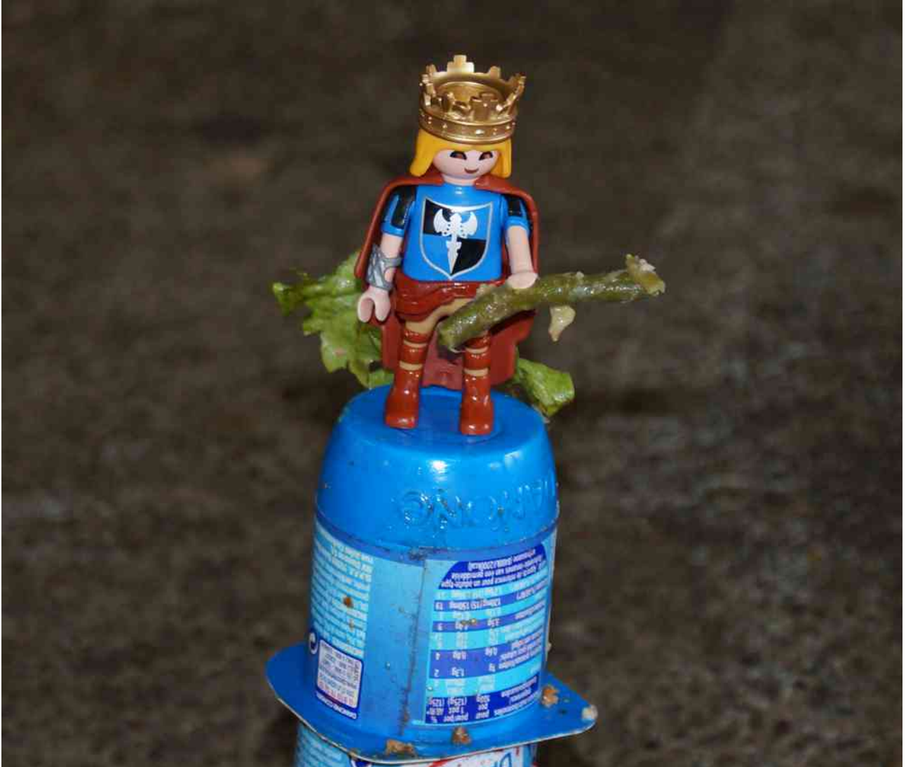
Le roi des haricots