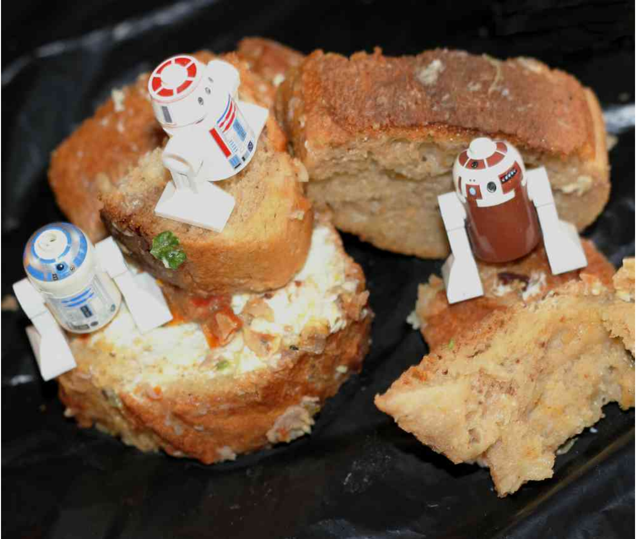
Robots contre pain