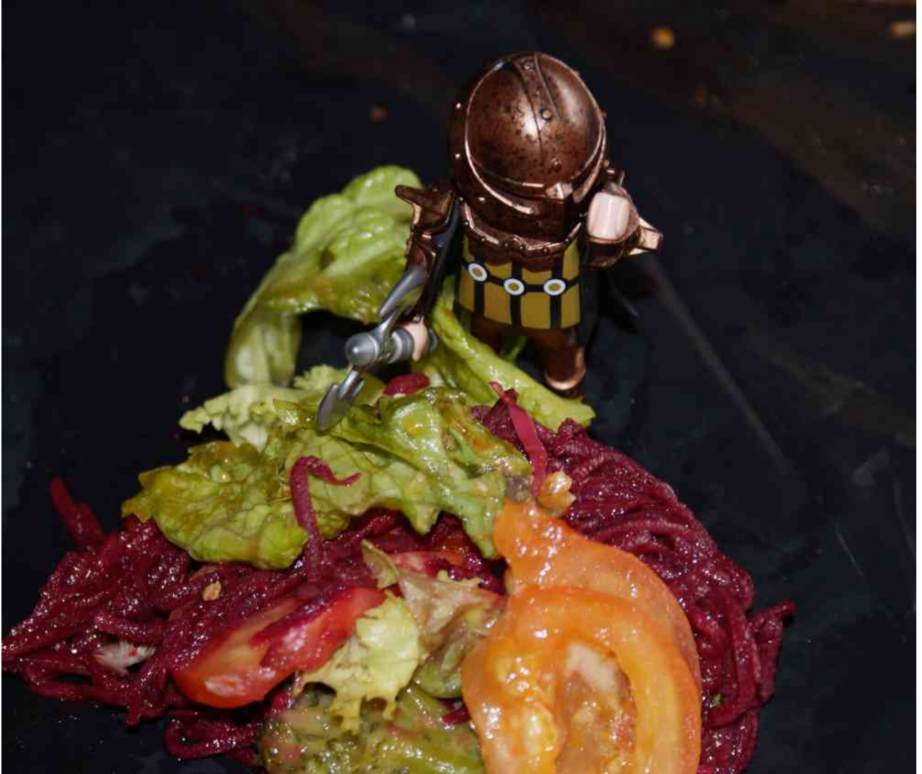
Le hacheur de légumes