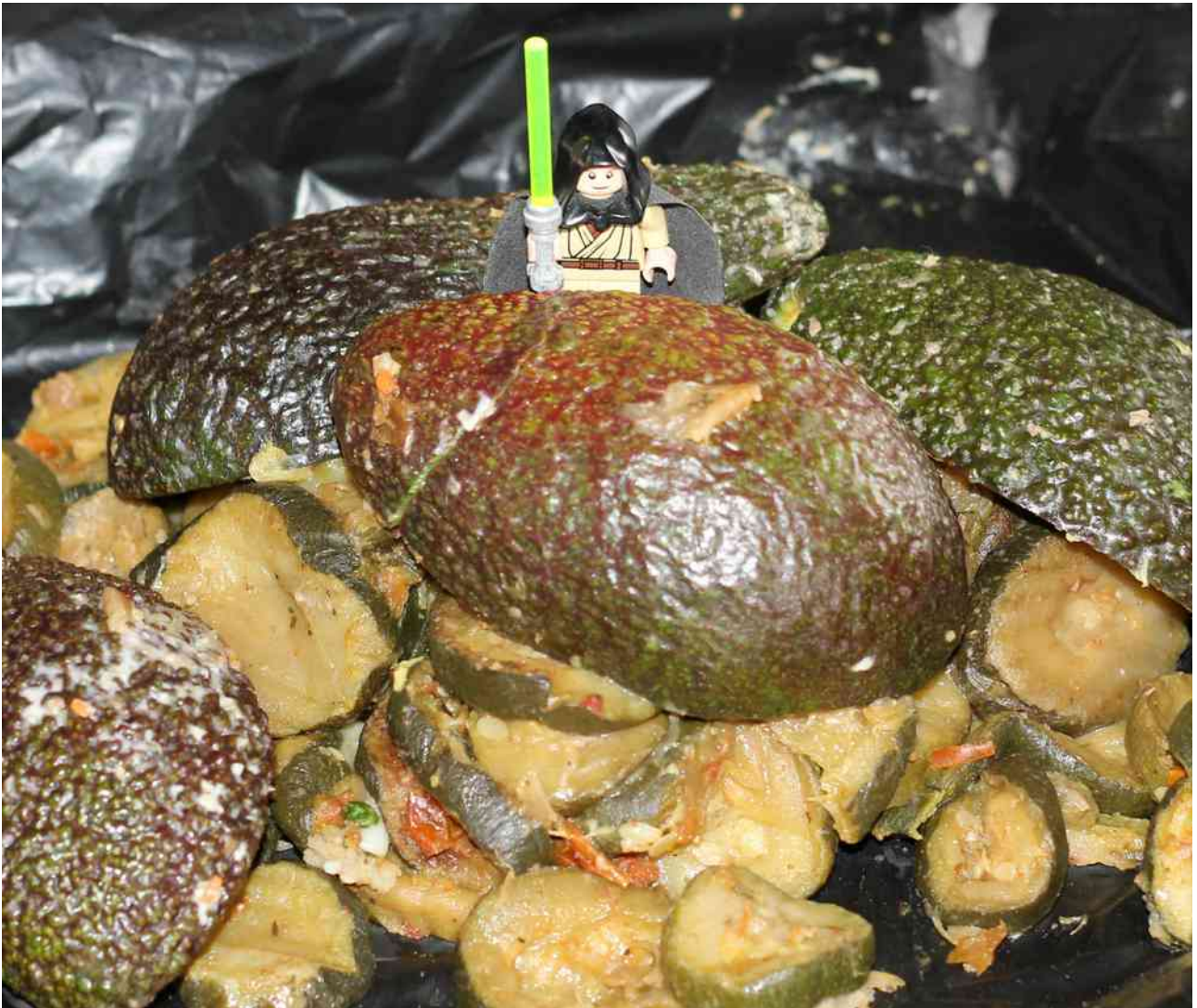
Jedi contre avocats et courgettes